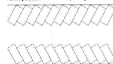
Figuur 4. Parkeerplaatsen 60° met de rijrichting