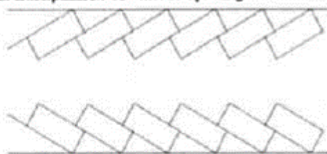
Figuur 2. Parkeerplaatsen 30° met de rijrichting