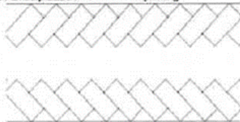
Figuur 3. Parkeerplaatsen 45° met de rijrichting